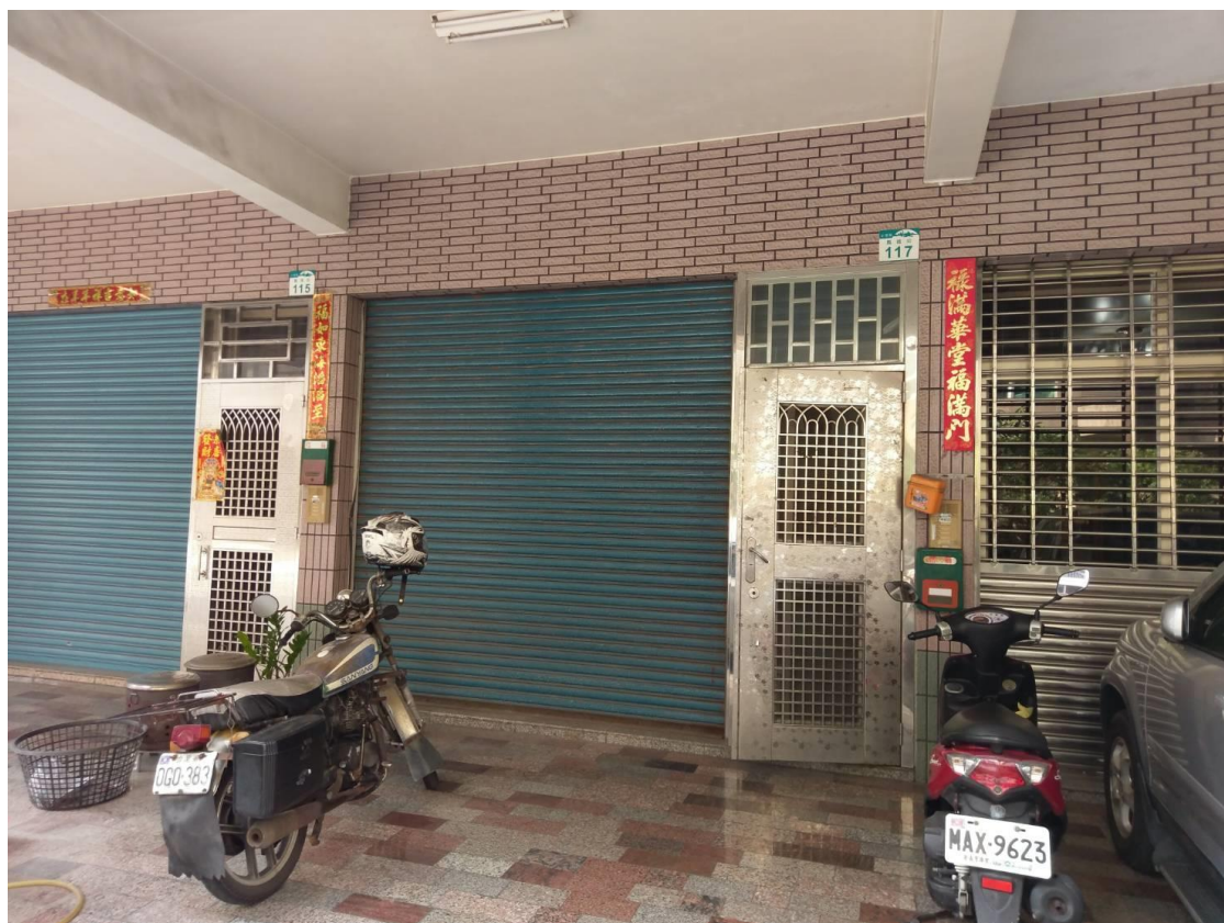
騎樓及一樓機車停車空間