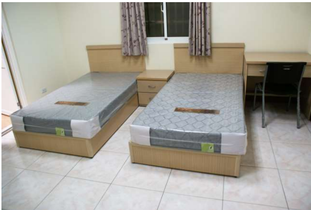
雙人房間內部設施