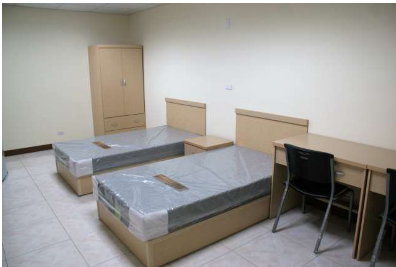
單人房間內部設施