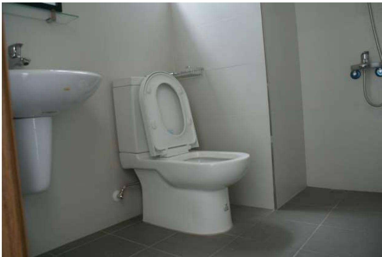
房間設施：房間衛浴設施