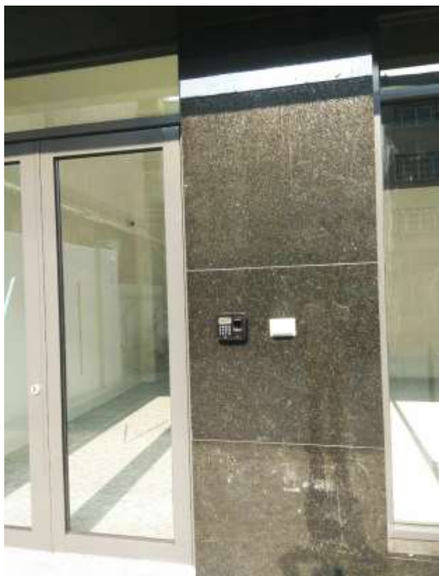
指紋辨識門禁系統