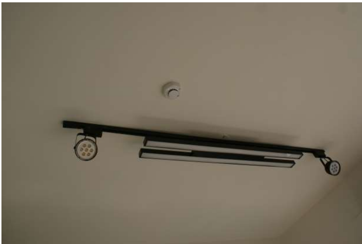
偵煙型火警警報器