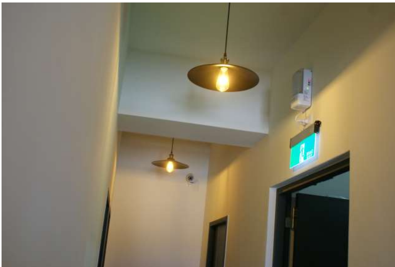
緊急照明燈、避難緊急出口指示燈、攝影機