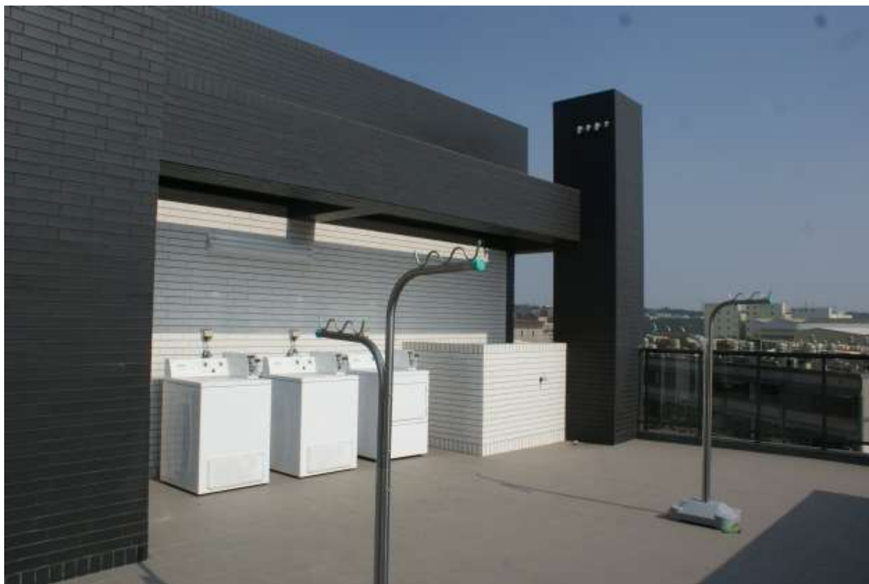
房間設施：頂樓洗衣機及曬衣空間