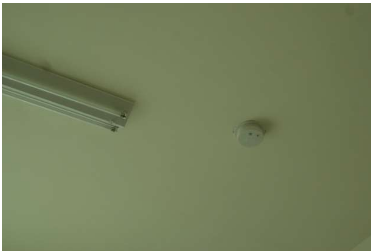
偵煙型火警警報器