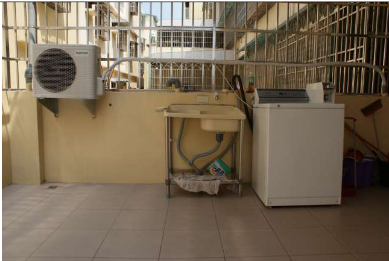
洗衣機及曬衣空間