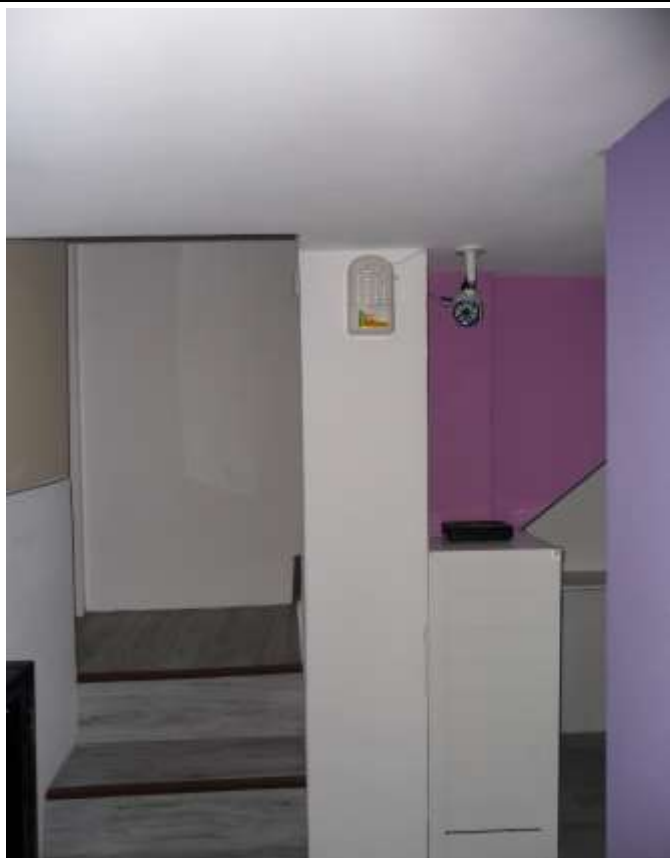
緊急照明燈(每樓 1 支)