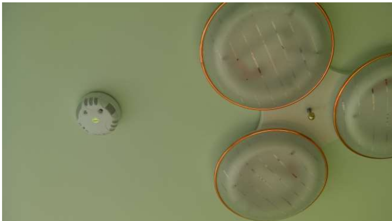
獨立式火警警報器(每房 1 支)