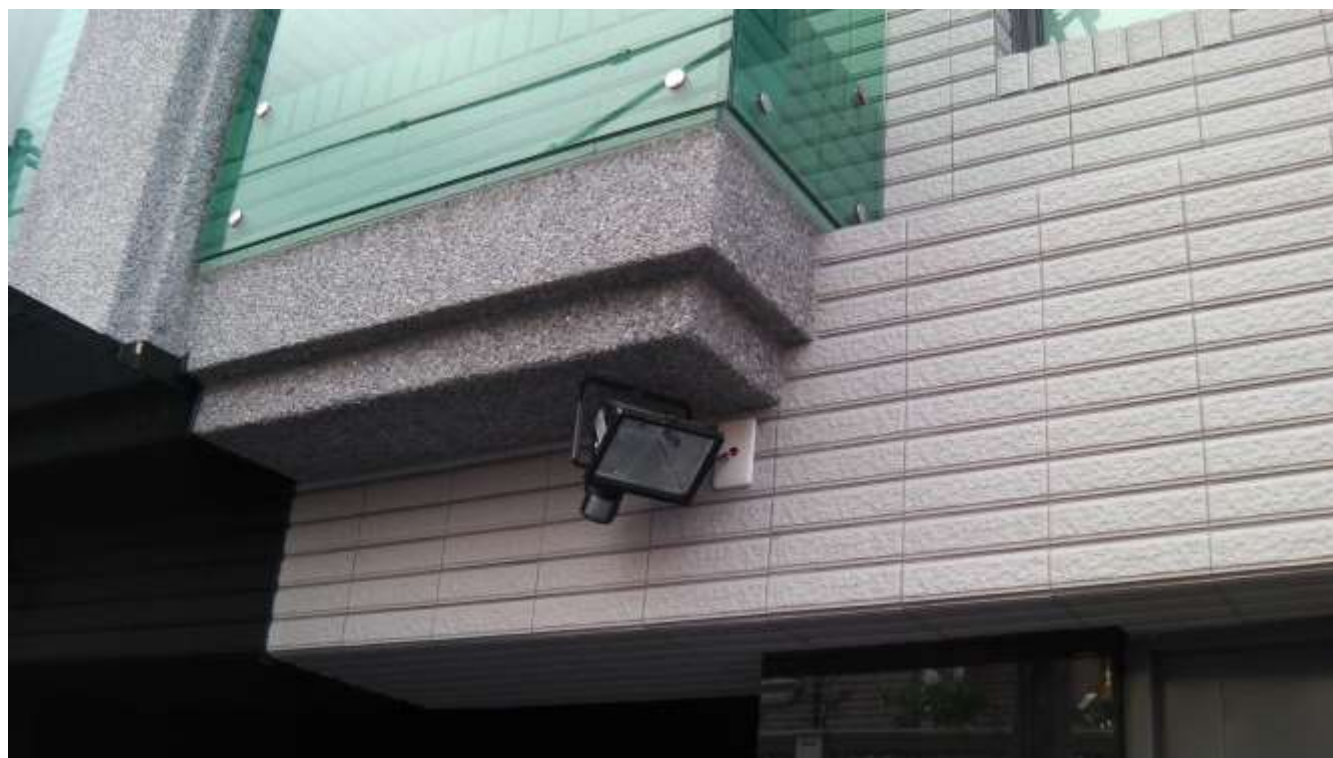
大門感應式照明燈