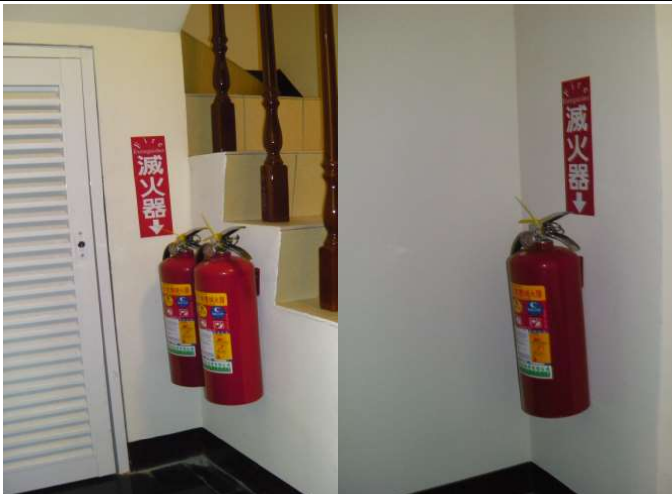
滅火器(1 樓 2 支，其他樓層各 1 支)