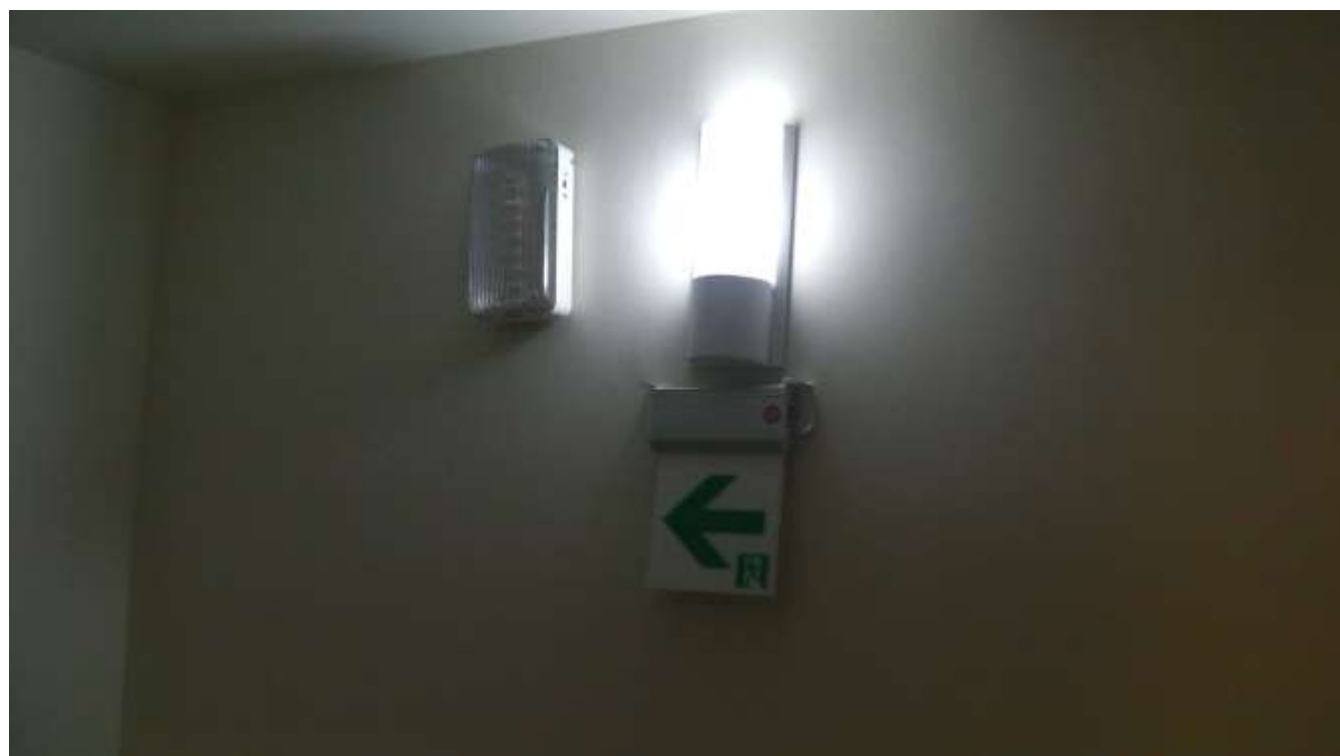
照明燈、緊急照明燈及避難方向指示燈(每樓層各 1 支)