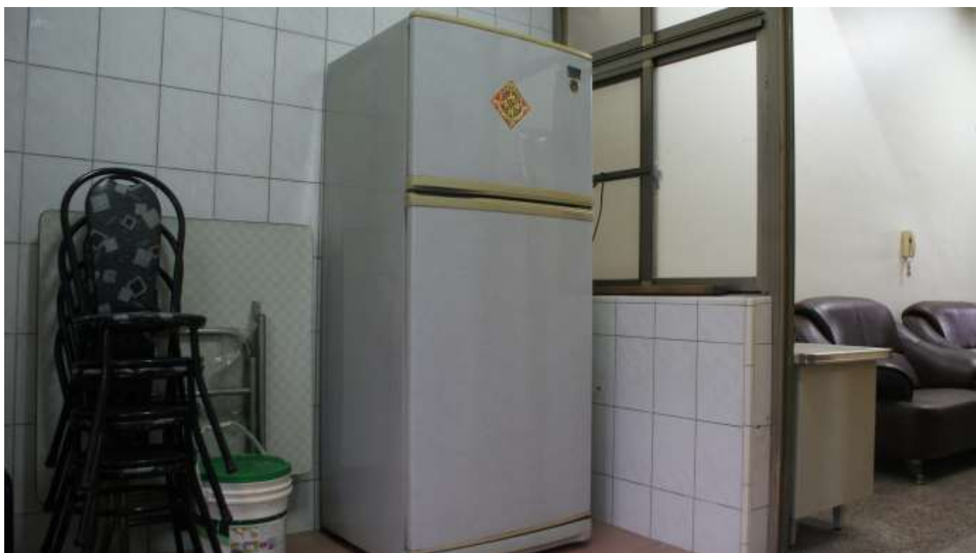
居家房間設備---廚房