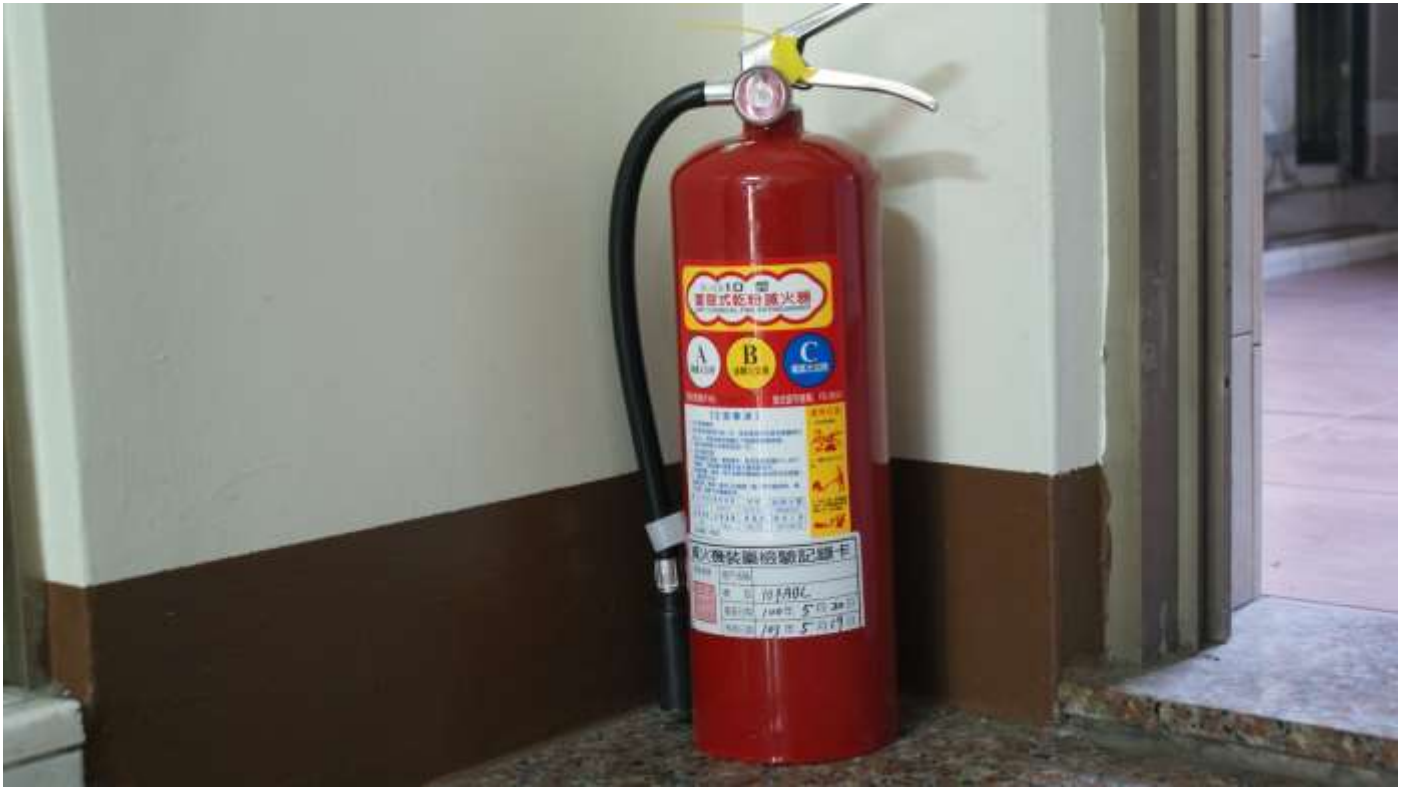
每層樓 1 具滅火器