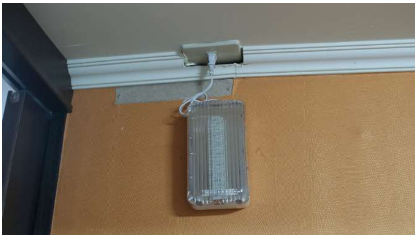
裝設緊急照明裝置 3 具