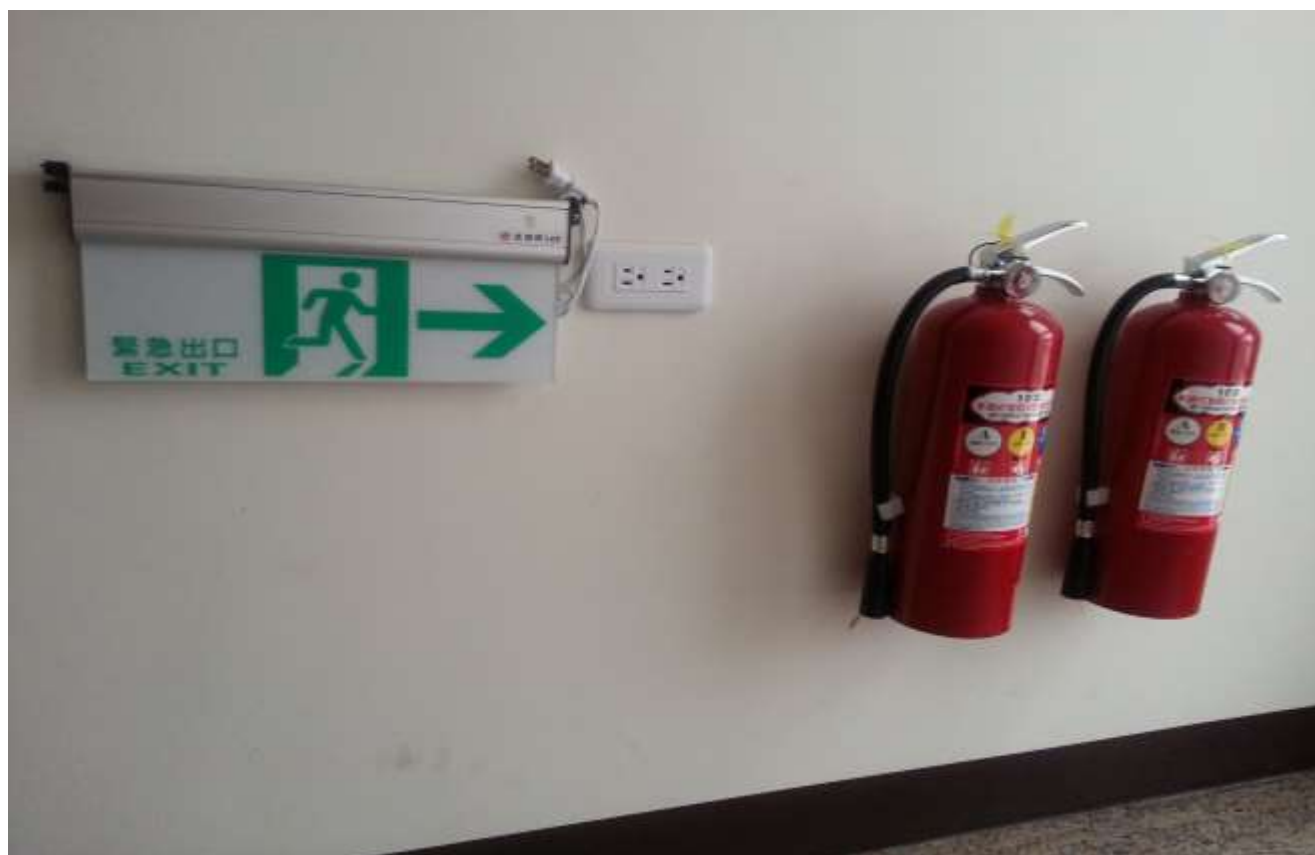
滅火器每樓 5 支