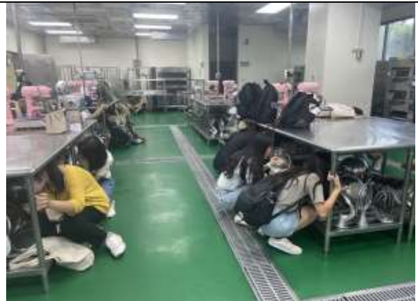
地震避難蹲下、掩護、抓住