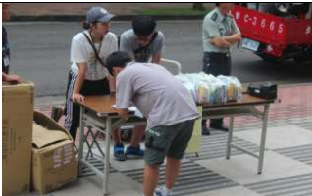
大規模災難物資發放演練