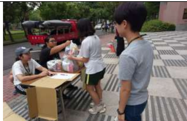
大規模災難物資發放演練