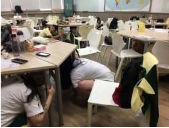
地震避難蹲下、掩護、抓住