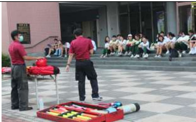
防汛及防溺水裝備展示及使用說明