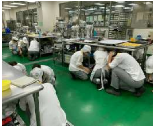
地震避難蹲下、掩護、抓住