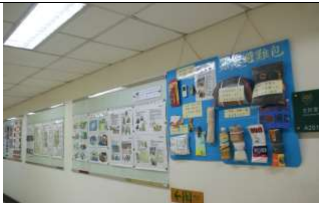
緊急避難包及災害防制文宣海報