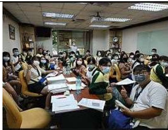
109. 9. 10 防災演練班級幹部說明會