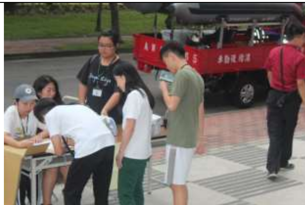
大規模災難物資發放演練