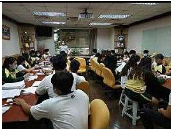
109. 9. 10 防災演練班級幹部說明會