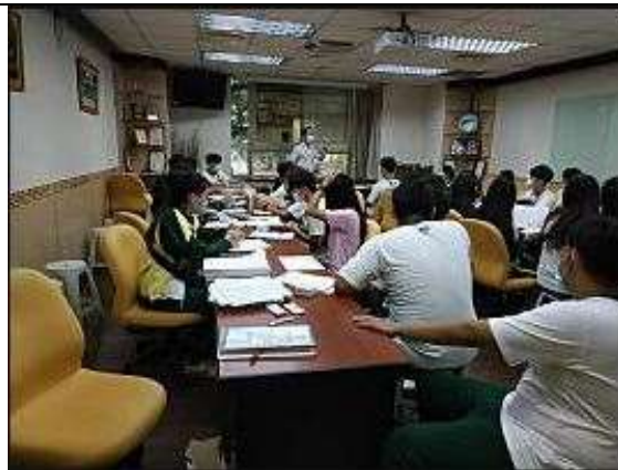
109. 9. 10 防災演練班級幹部說明會