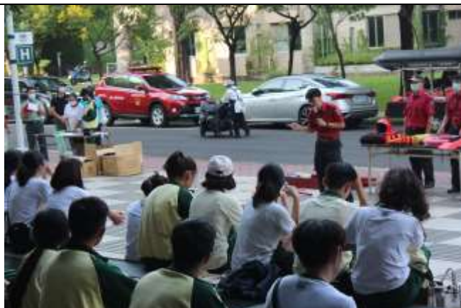
防汛及防溺水裝備展示及使用說明