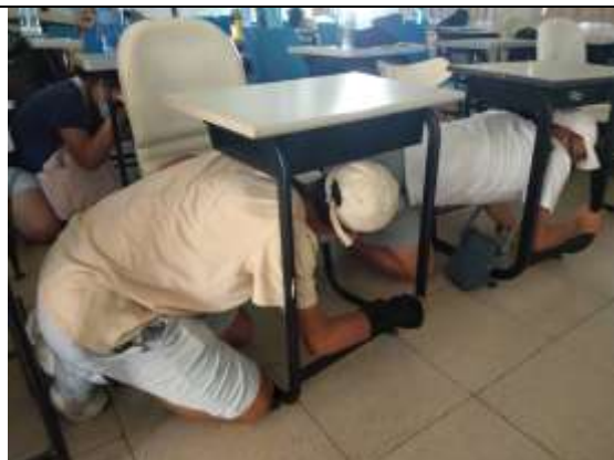
地震避難蹲下、掩護、抓住