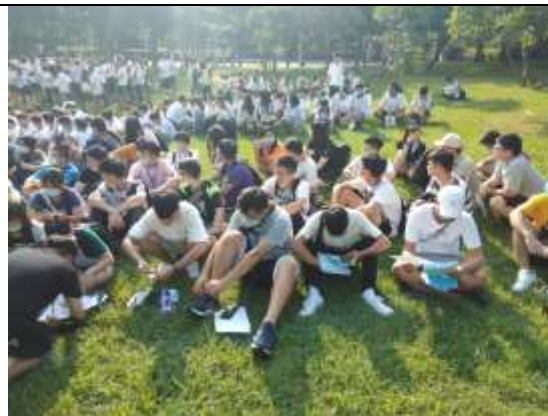
避難疏散集合情形