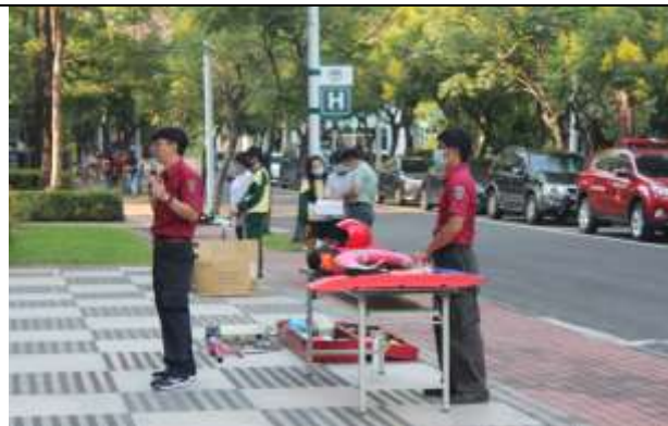
防汛及防溺水裝備展示及使用說明