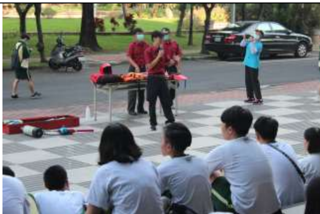
防汛及防溺水裝備展示及使用說明