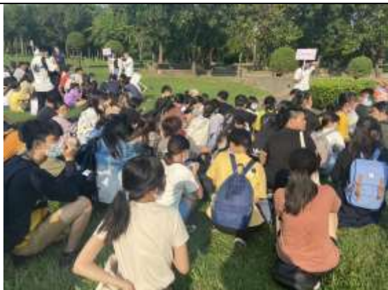
避難疏散集合情形