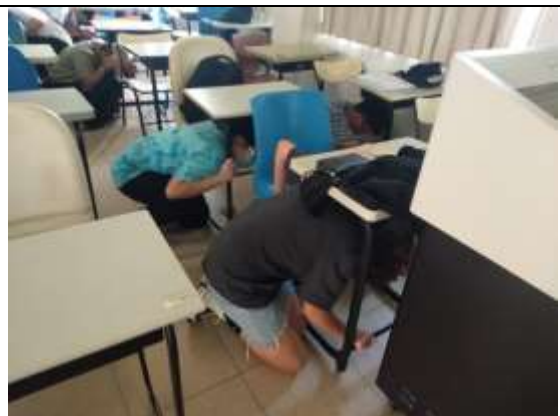
地震避難蹲下、掩護、抓住