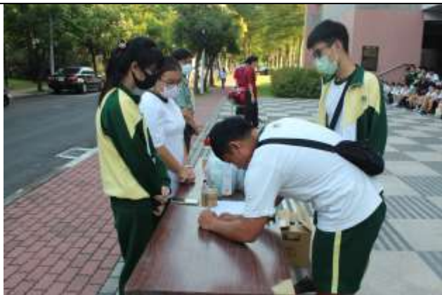
大規模災難物資發放演練