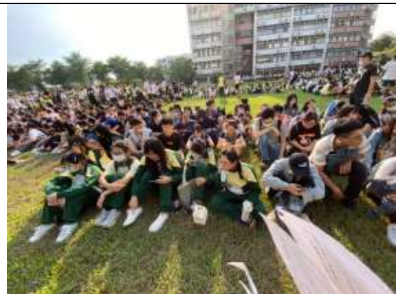
避難疏散集合情形