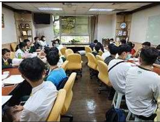
109. 9. 10 防災演練班級幹部說明會