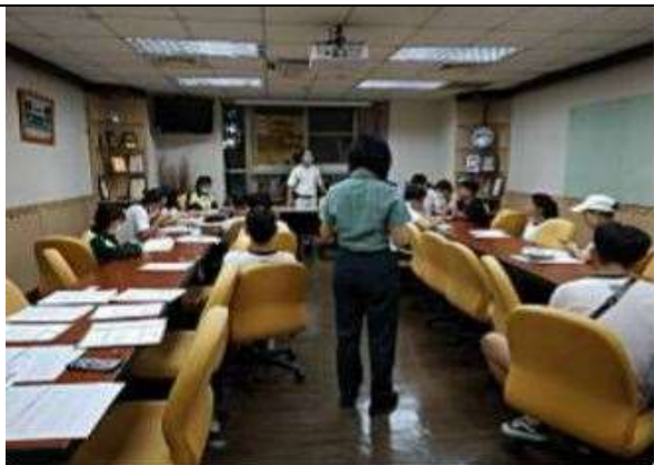
109. 9. 10 防災演練班級幹部說明會