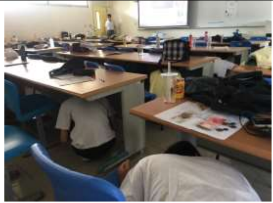
地震避難蹲下、掩護、抓住