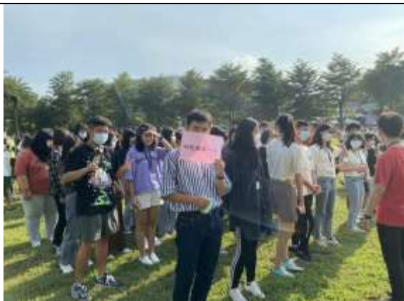
避難疏散集合情形