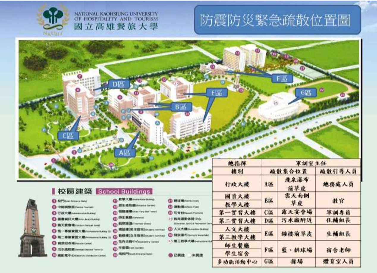
附件 5 疏散集合班級位置圖

教學大樓西側草皮面對教學大樓（璟琮教官負責，宿舍值班人員）（舉牌 3 人、各班引導幹部 1 人，各班依學號成 10 伍正面）46 班