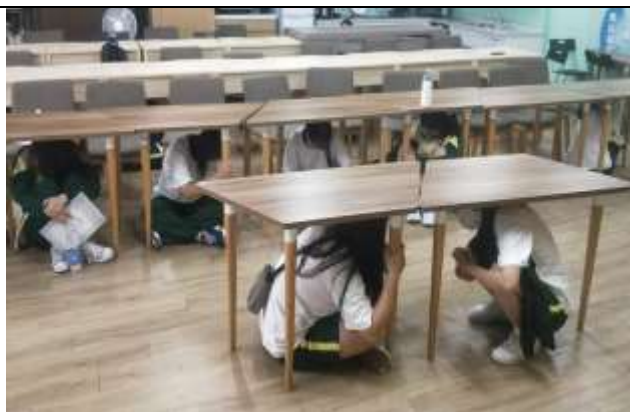
地震避難趴下、掩護、穩住