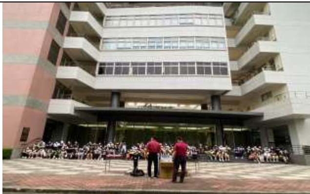
防汛及防溺裝備展示及使用說明