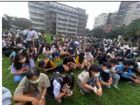
避難疏散集合情形