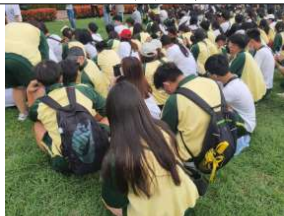
避難疏散集合情形