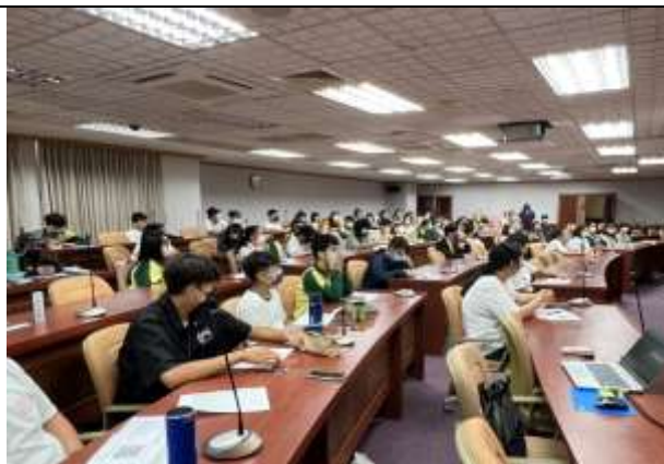
111. 9. 14 防災演練班級幹部說明會