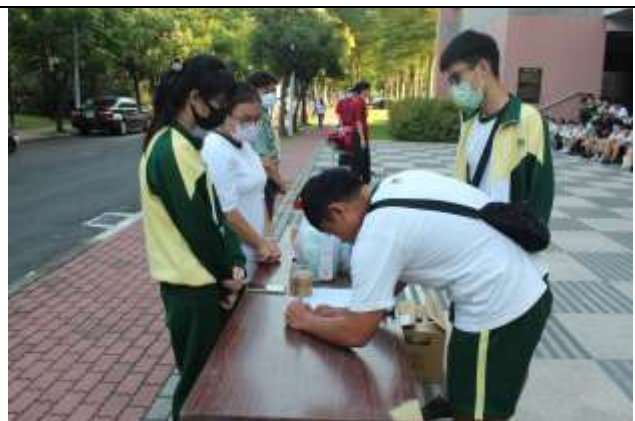
大規模災難物資發放演練