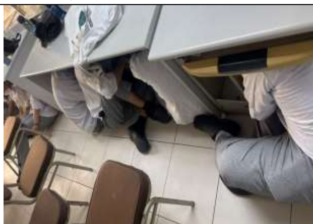
地震避難趴下、掩護、穩住