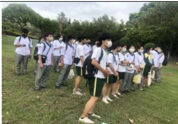
避難疏散集合情形