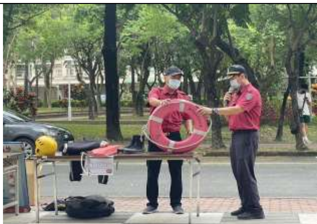
防汛及防溺裝備展示及使用說明