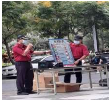
防汛及防溺裝備展示及使用說明