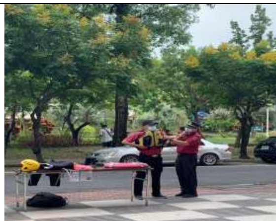
防汛及防溺裝備展示及使用說明