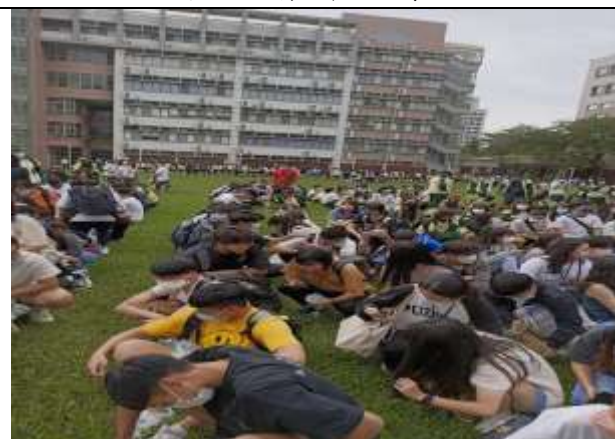
避難疏散集合情形