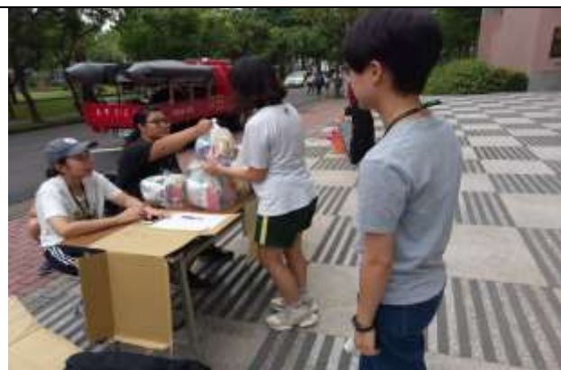
大規模災難物資發放演練