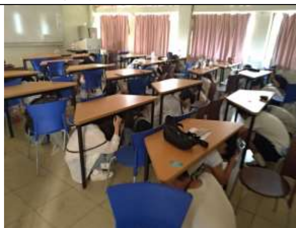
地震避難趴下、掩護、穩住