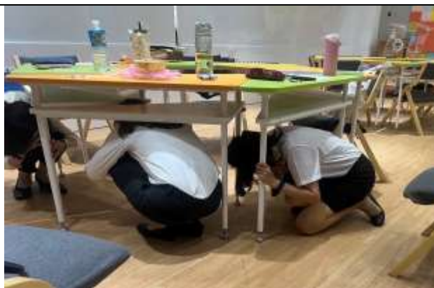
地震避難趴下、掩護、穩住