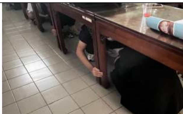
地震避難趴下、掩護、穩住