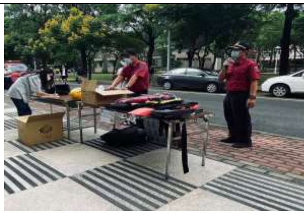
大規模災難物資發放演練