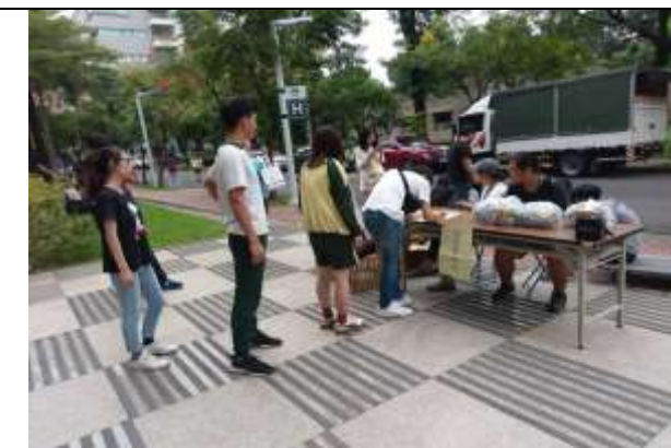
大規模災難物資發放演練