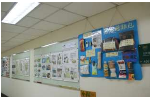
緊急避難包及災害防制文宣海報