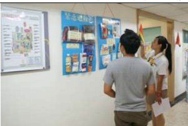
緊急避難包及災害防制文宣海報