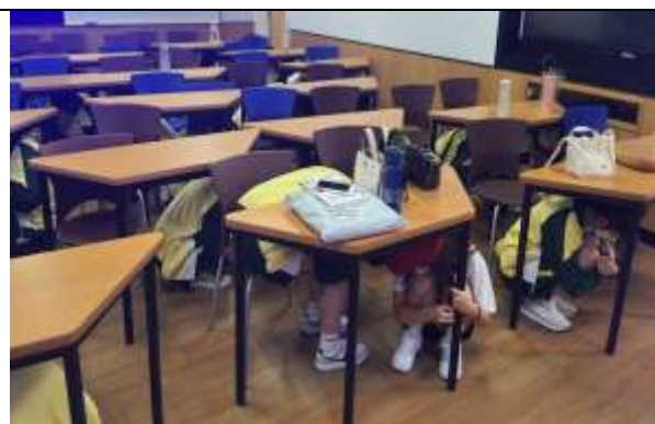
地震避難趴下、掩護、穩住