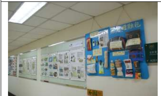
緊急避難包及災害防制文宣海報