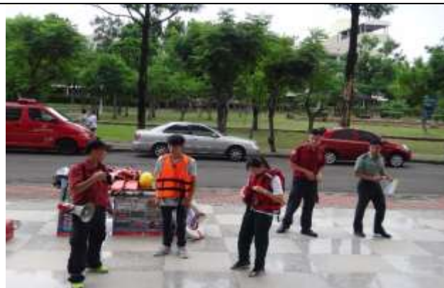
防汛及防溺水裝備展示及使用說明