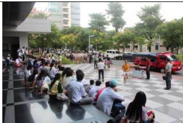
大規模災難物資發放演練