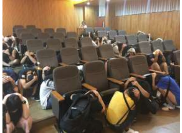
地震避難蹲下、掩護、抓住