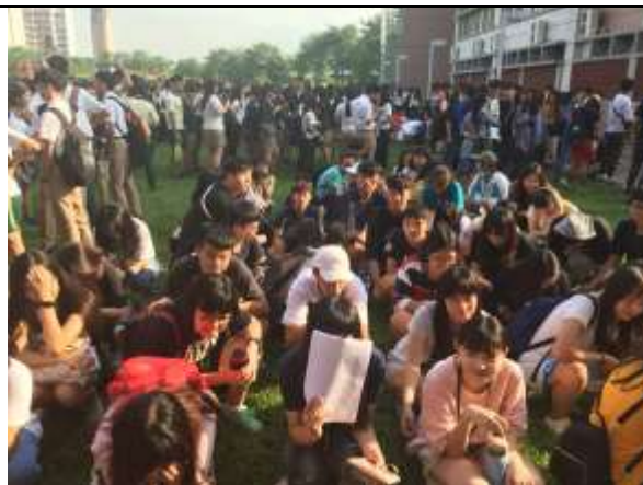
避難疏散集合情形