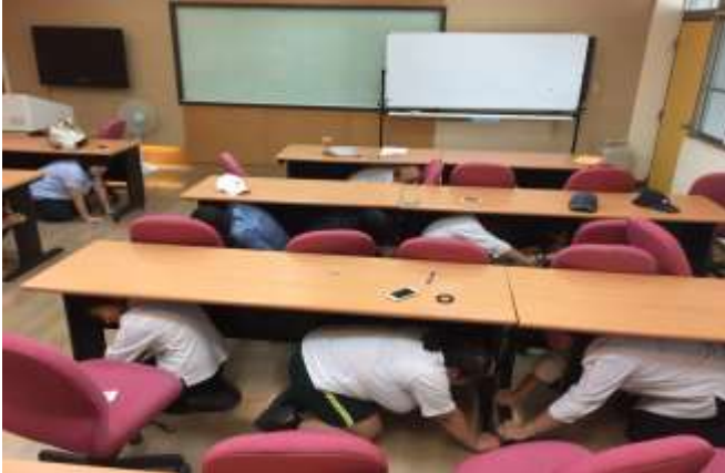
地震避難蹲下、掩護、抓住