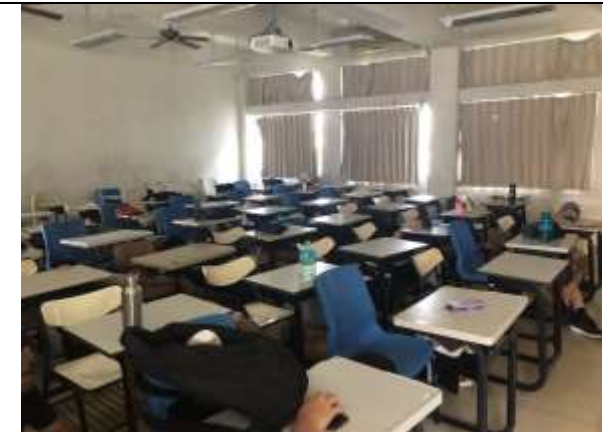
地震避難蹲下、掩護、抓住