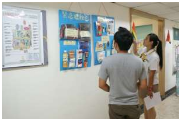
緊急避難包及災害防制文宣海報