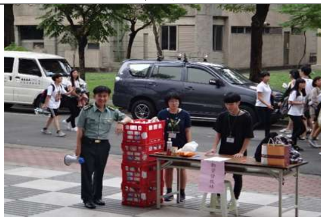
大規模災難物資發放演練