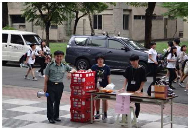
防汛及防溺水裝備展示及使用說明