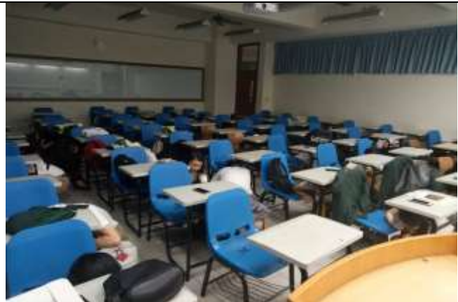
地震避難蹲下、掩護、抓住