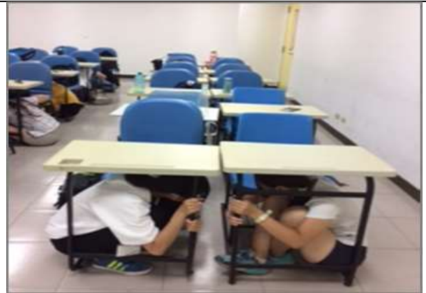
地震避難蹲下、掩護、抓住