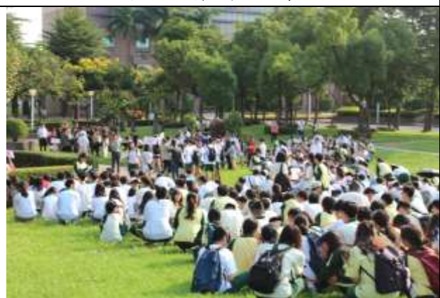
避難疏散集合情形