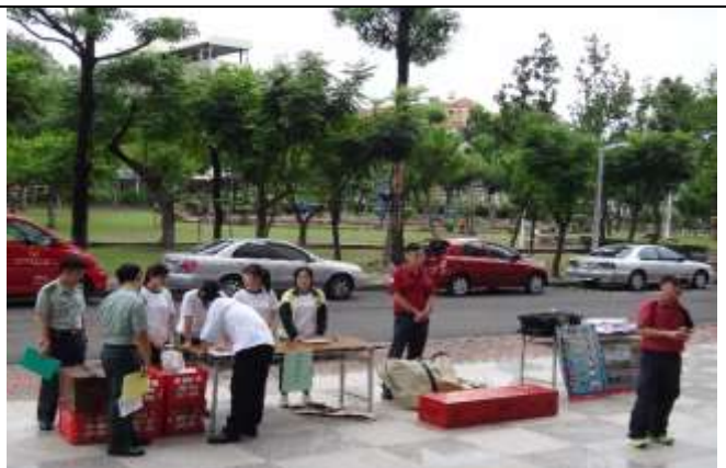
大規模災難物資發放演練