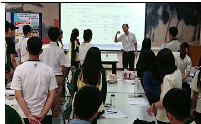
107. 9. 13 防災演練班級幹部說明會