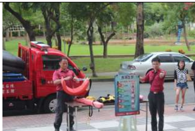
防汛及防溺水裝備展示及使用說明