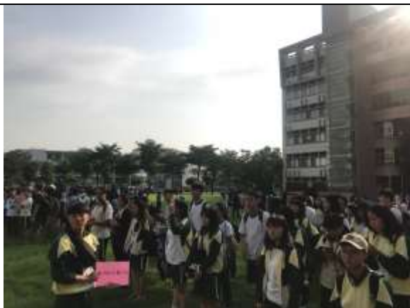
避難疏散集合情形