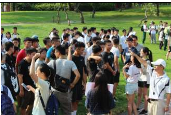
避難疏散集合情形