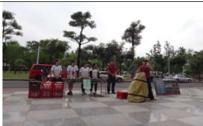
防汛及防溺水裝備展示及使用說明