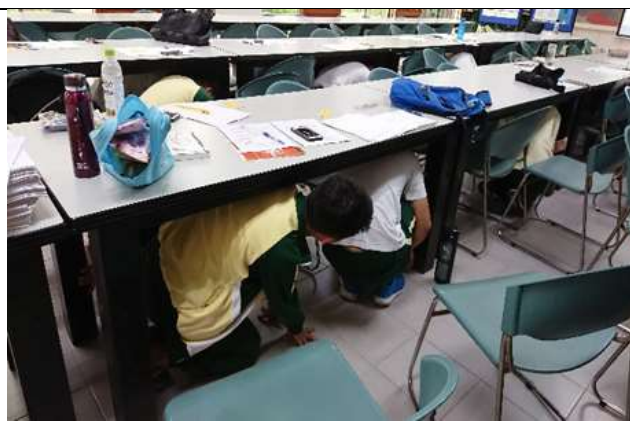
107. 9. 13 班級幹部避難演練