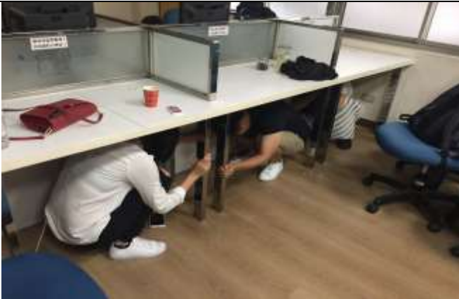
地震避難蹲下、掩護、抓住