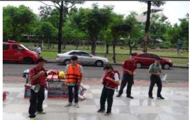
防汛及防溺水裝備展示及使用說明