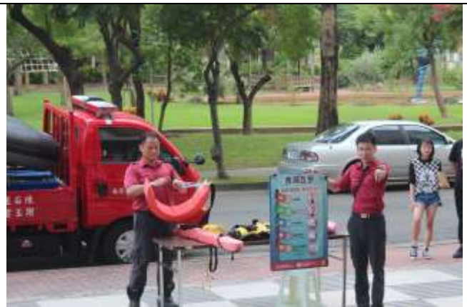
防汛及防溺水裝備展示及使用說明