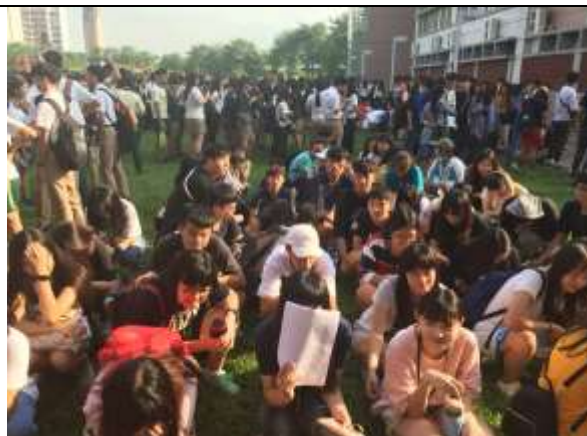
避難疏散集合情形