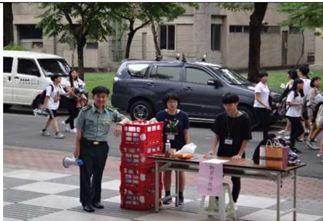
防汛及防溺水裝備展示及使用說明