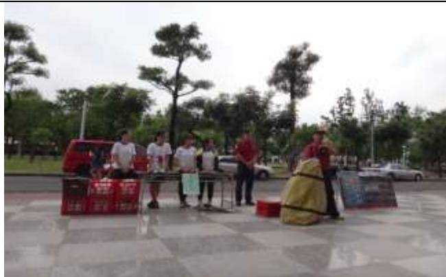
防汛及防溺水裝備展示及使用說明