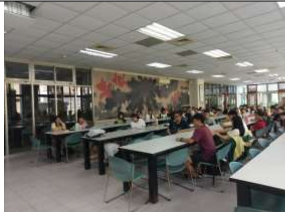
108.9.11 防災演練班級幹部說明會