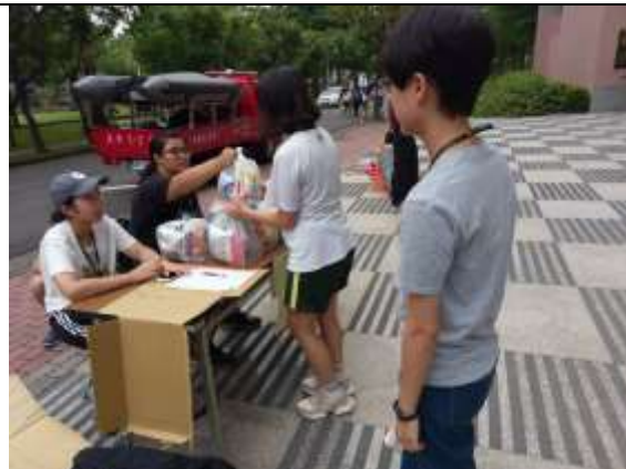
大規模災難物資發放演練