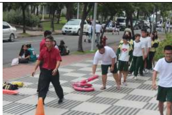
防汛及防溺裝備展示及使用說明