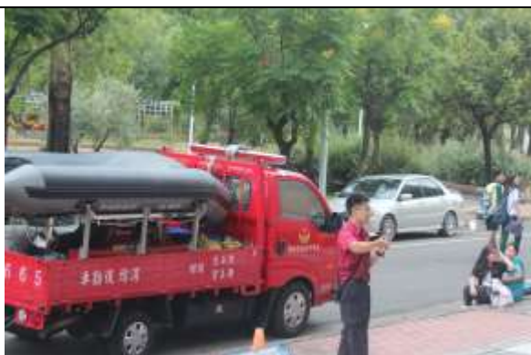
防汛及防溺裝備展示及使用說明