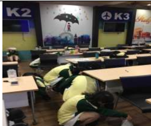
地震避難蹲下、掩護、抓住