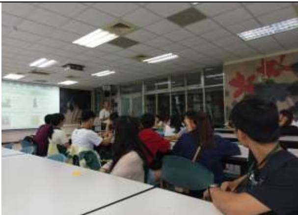
108.9.11 防災演練班級幹部說明會