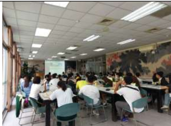
108.9.11 防災演練班級幹部說明會