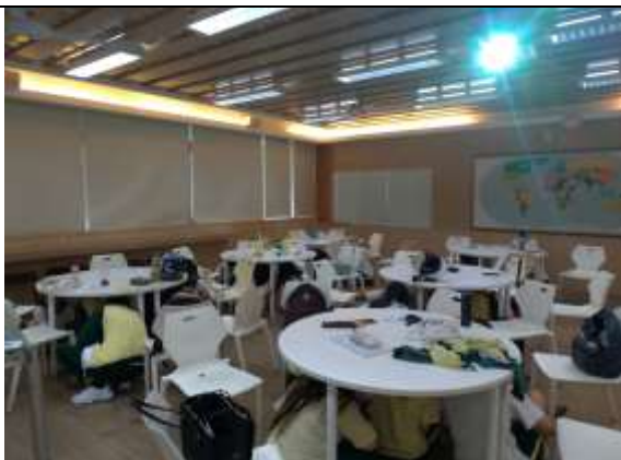
地震避難蹲下、掩護、抓住