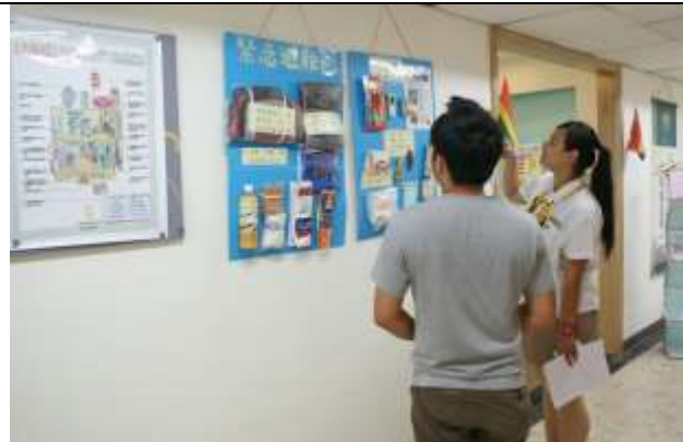
緊急避難包及災害防制文宣海報