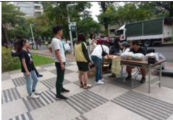
大規模災難物資發放演練