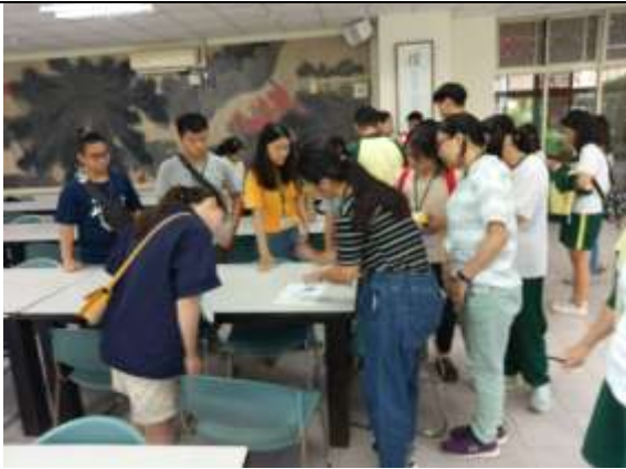
108.9.11 防災演練班級幹部說明會