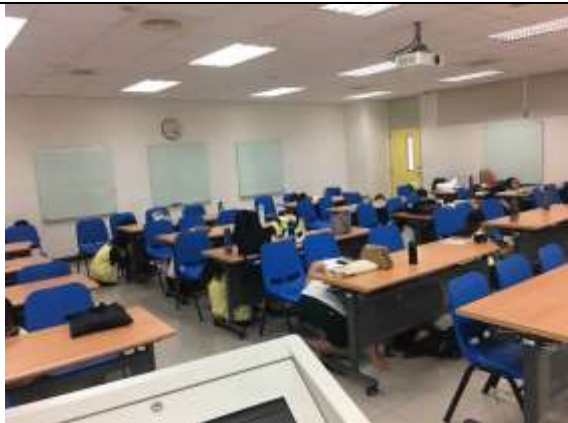
地震避難蹲下、掩護、抓住