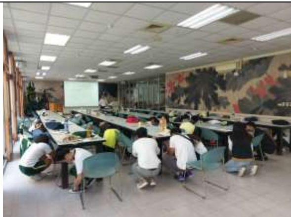
108.9.11 班級幹部避難演練