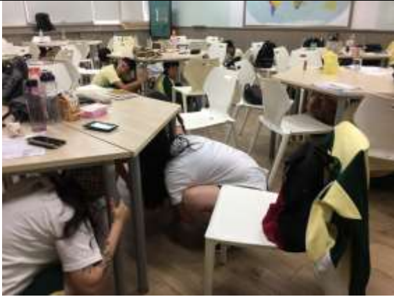
地震避難蹲下、掩護、抓住