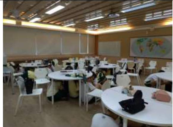
地震避難蹲下、掩護、抓住