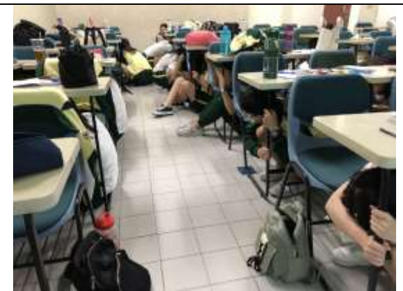
地震避難蹲下、掩護、抓住