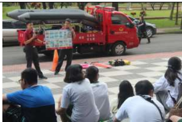
防汛及防溺裝備展示及使用說明