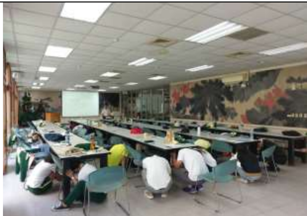
108.9.11 班級幹部避難演練