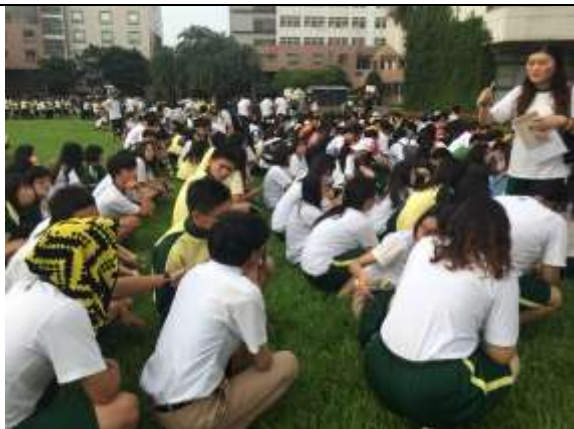
避難疏散集合情形