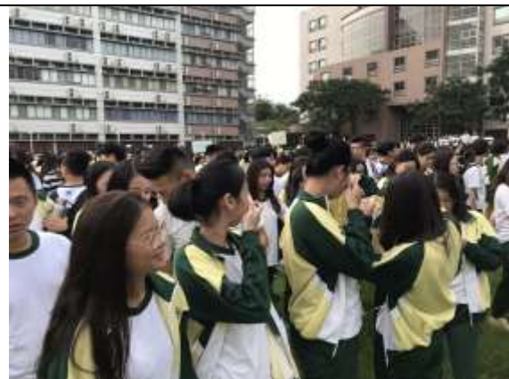
避難疏散集合情形