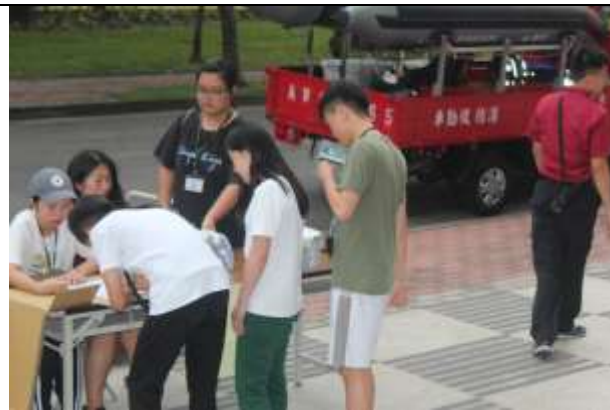
大規模災難物資發放演練