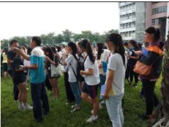
避難疏散集合情形