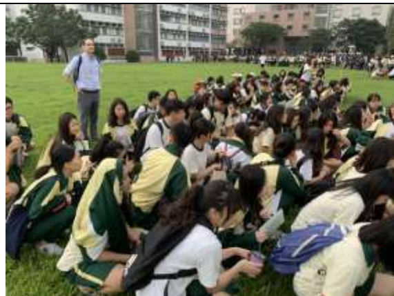
避難疏散集合情形