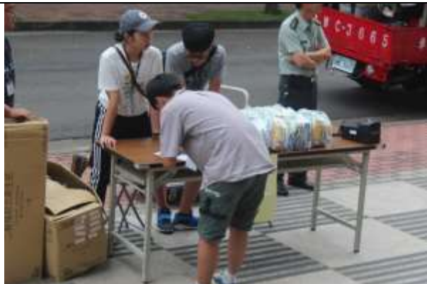
大規模災難物資發放演練