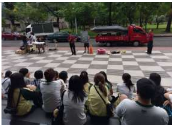
防汛及防溺裝備展示及使用說明